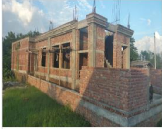
वडा नं १२ चसमान वस्ति नविक्रमा मासुदायिक भवन निर्माण कार्य