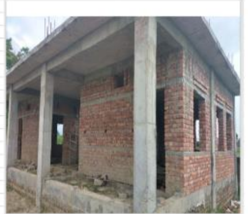
श्री अध्यात्म विद्यालय विद्यालयको दुई कोठे कक्षा निर्माण कार्य